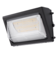
Applique murale DEL à sélection double