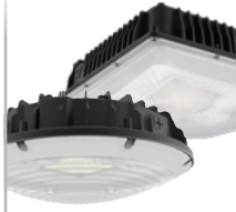
Garage et marquise DEL à sélection double