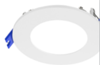
Encastré plat DEL à sélection double