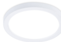
Encastré montage en surface DEL à sélection double