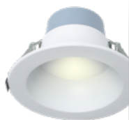
Encastré pour modernisation commerciale DEL à sélection double