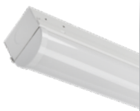
SDS réglette sélectionnable DEL à sélection double