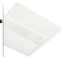
Trousse de modernisation EvoKit Click DEL à sélection double