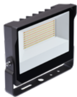
Slim Flood DEL à sélection double