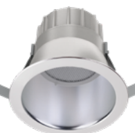
ModuLyte DEL à sélection double