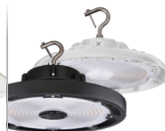
HCY scellé pour très grande hauteur DEL à sélection double