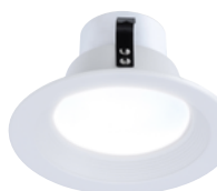
Encastré pour modernisation résidentielle DEL à sélection