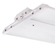
FCY valeur pour très grande hauteur DEL à sélection double