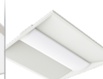
DSRT luminaire linéaire encastré sélectionnable DEL à sélection double