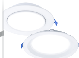
Encastré à cardan et encastré DEL à sélection double