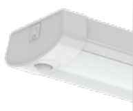
NWL enveloppant DEL à sélection double