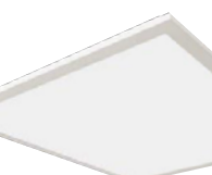
SBP panneau à rétroéclairage sélectionnable DEL à sélection double