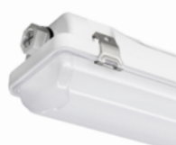
VTS Vaportite DEL à sélection double