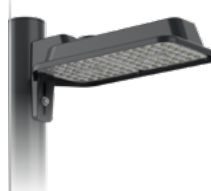
LytePro pour grandes surfaces DEL à sélection